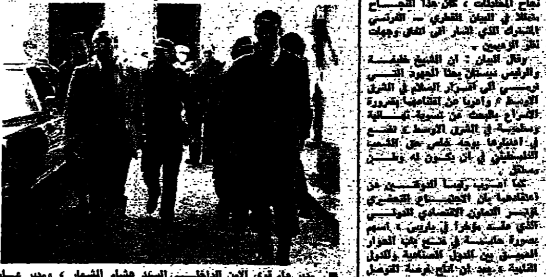
وزير الخارجية القطري الشيخ محمد بن عبد الرحمن آل ثاني (يسار) مع وزير الخارجية الفرنسي جاك دي كورنيليو (يمين) في باريس، 11 يونيو 2014.

بباريس مع من قبل اليان المشترك القطري - الفرنسي يعكس نجاح مباحثات الشيخ خليفة ودبيستان. في باريس، في 11 يونيو، اجتمع في باريس ممثلو الجانبين في اجتماع مشترك، وهو الاجتماع الثاني من نوعه بين الجانبين، وذلك بعد اجتماعهما في 2 يونيو. وفي هذا الاجتماع، تم التوقيع على بيان مشترك، يحدد المبادئ العامة لتعاون مشترك بين الجانبين في مختلف المجالات الاقتصادية والتجارية والثقافية.